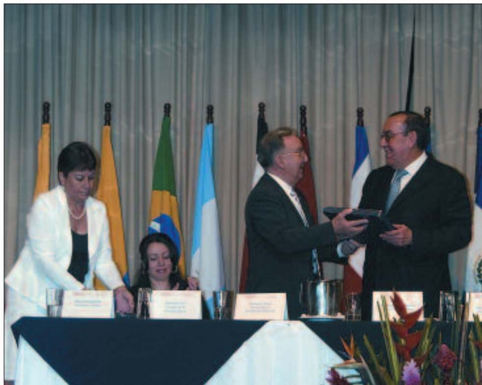
... de estar presente. Si acudió el ministro de la Presidencia. FP

ciones en todos los niveles –las familias, las comunidades y las naciones– como fundamental para el logro de una sociedad para todas las edades.