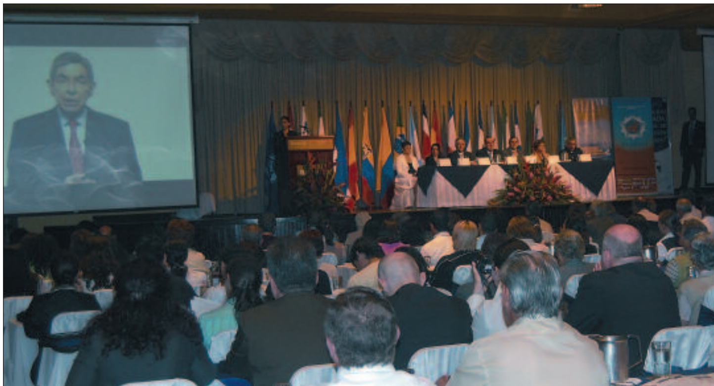
El acto de inauguración contó con unas palabras del presidente de la República de Costa Rica, Oscar Arias, quien dejó su intervención en vídeo ante la imposibilidad