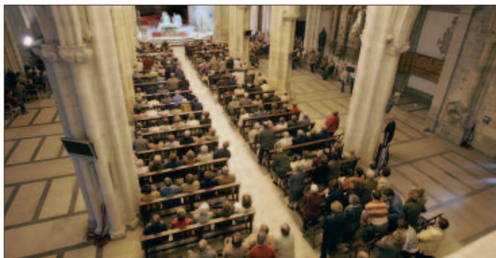
La misa estuvo oficiada por el obispo de Santander (España). FP

La Universidad Nacional Aulas de la Tercera Edad-UNATE celebró en octubre su 30 aniversario. Para ello contó con una misa oficiada por el obispo de Santander, Vicente Zamora a la que asistieron más de mil personas. Tras ello se celebró una comida de hermandad con más de quinientos comensales.