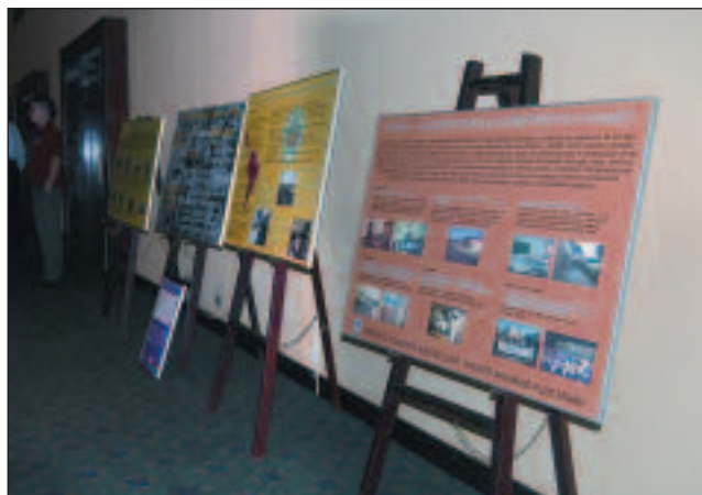
Actos en la Aduana y la cena de gala del encuentro.

El III Encuentro Intergeneracional reunió a los adultos mayores y a las asociaciones que les representan con jóvenes universitarios de Costa Rica. Todos ellos en torno a un denso programa de ponencias y conferencias magistrales que abordaron la construcción de una sociedad para todas las edades, la violación de los derechos humanos en la juventud y la vejez, las oportunidades laborales en la segunda juventud o la educación emprendedora como instrumento de desarrollo y democratización en Costa Rica. Las conferencias y ponencias pueden consultarse en www.fiapam.org .