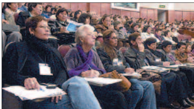
Asistentes al encuentro. FP