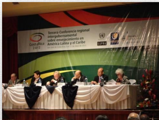
Sesión inaugural de la III Reunión Intergubernamental sobre envejecimiento

En mayo de 2012, la Tercera Conferencia Regional Intergubernamental celebrada en Costa Rica, sirvió para dar un nuevo impulso a este proceso fijando las prioridades para los siguientes cinco años, además de evaluar los resultados obtenidos hasta la fecha. Además, por primera vez se incluyeron en los trabajos de esta conferencia las conclusiones del encuentro regional de organizaciones de la sociedad civil que había precedido a la conferencia.