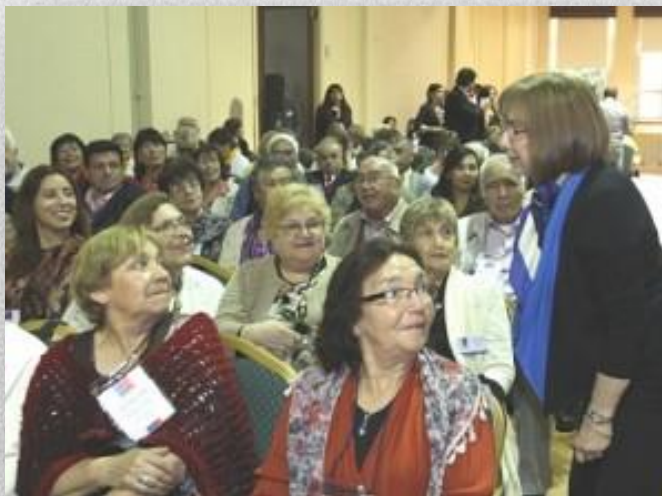
Encuentro Nacional de Consejos Asesores

Las reflexiones realizadas por los Consejeros durante la sesión de trabajo versaron sobre: las funciones de los consejos, el decreto que los creó y los aprendizajes de la experiencia, el fortalecimiento de la participación de las personas mayores, el trabajo con las personas mayores no organizadas, la renovación de los estilos de liderazgo, la relación con el territorio, la salud, el transporte, las pensiones, la habitabilidad, el buen y mal trato, la educación, la capacitación, las oportunidades laborales, la economía y el consumo, planteando el problema y diseñando posibles soluciones para cada una de las temáticas revisadas.