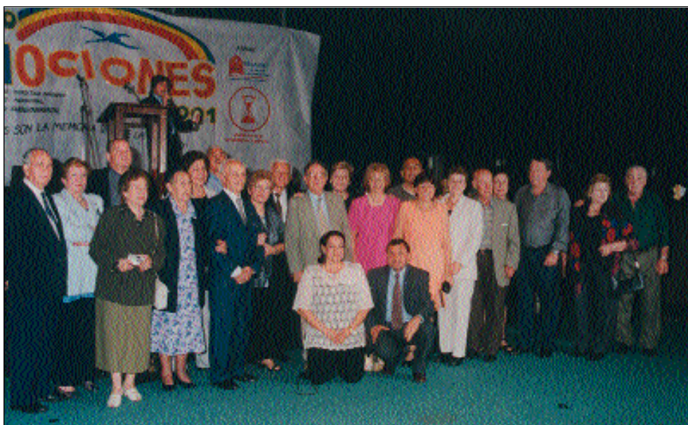
Algunos participantes del II Encuentro de Responsables de AA.MM Iberoamérica.