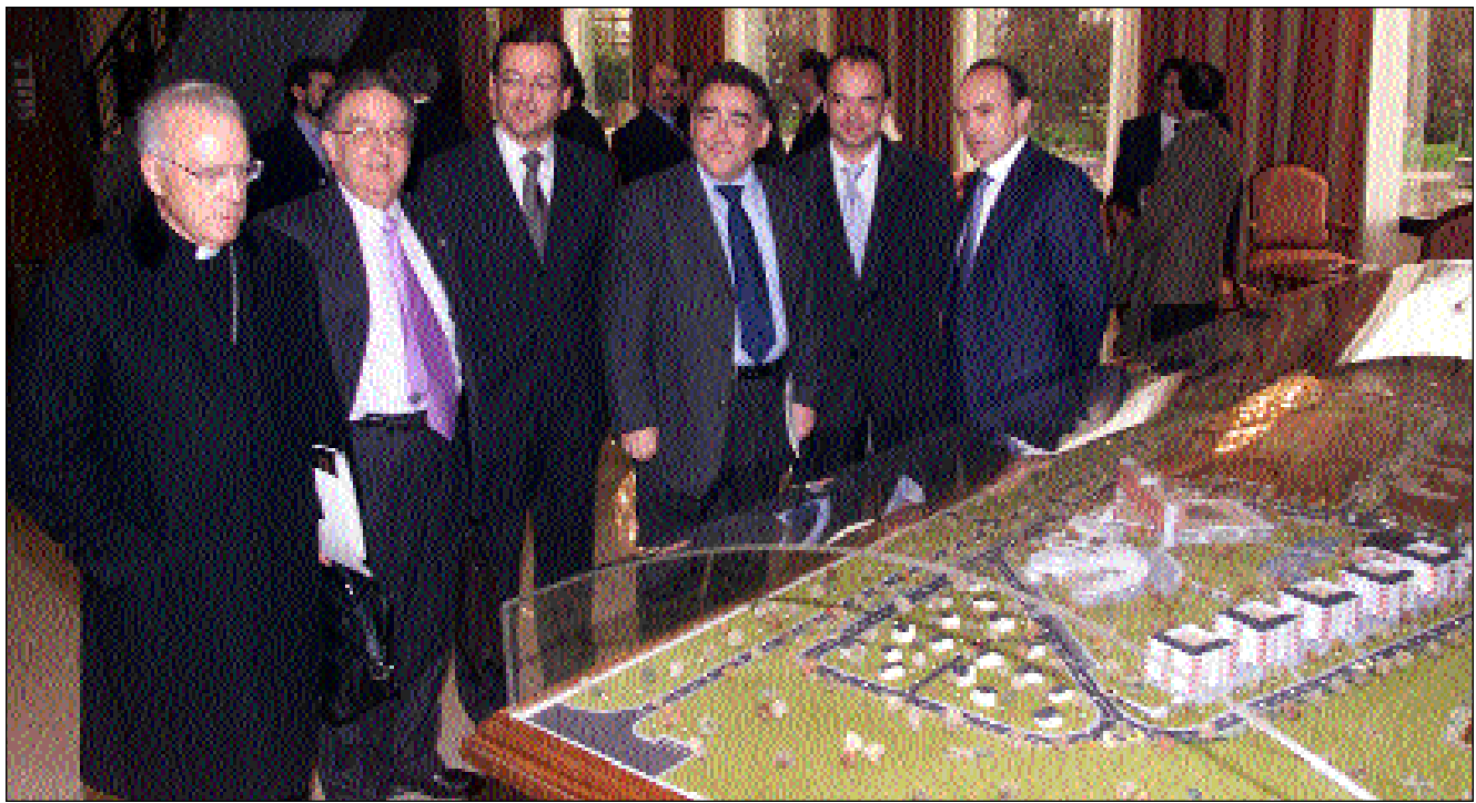
Principales autoridades y responsables del proyecto junto a la maqueta de «Villamayor».