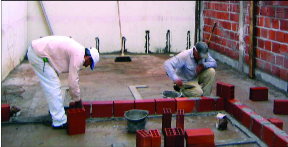
Las obras para construir tres aulas destinadas a la capacitación y la formación profesional para jóvenes y mujeres de San Gerardo ya están en marcha.