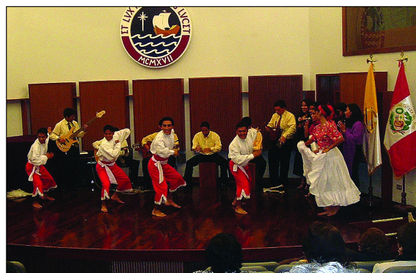
Inauguración del congreso. FP

y que esto no ha menudado los deseos de aprender para seguir adelante como personas, con todas sus facultades vitales.