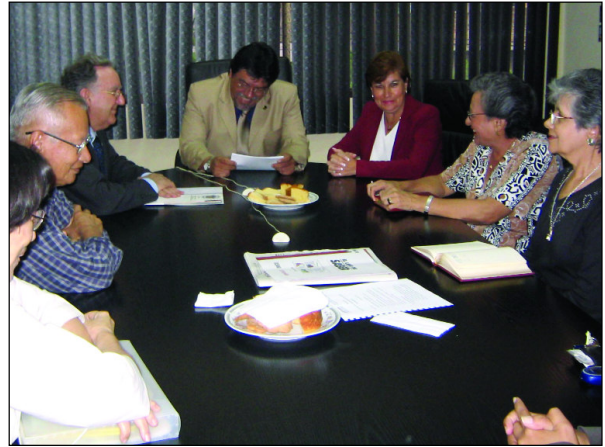
Intercambio de regalos con la Primera Dama de Honduras (izquierda) y reuni n con la Universidad Nacional de Honduras (derecha). F.P.