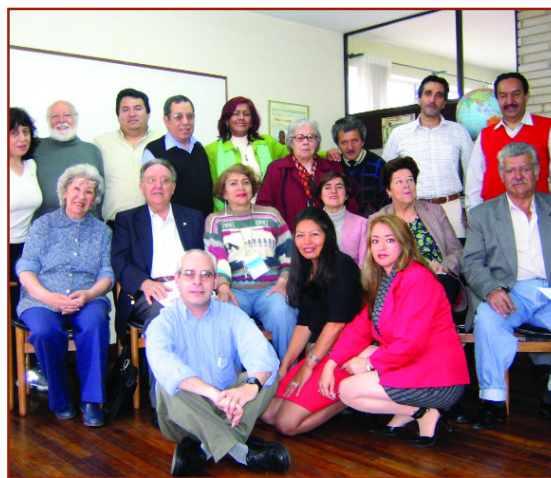
FIAPAM con las asociaciones de mayores de Colombia . FP