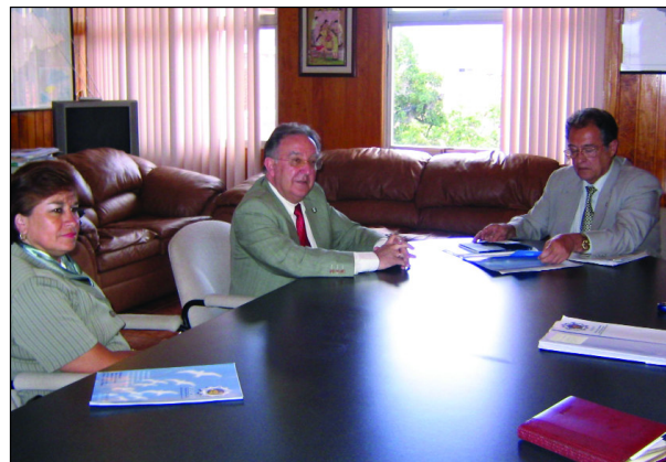
Entrevistas con los viceministros de Salud y Educación