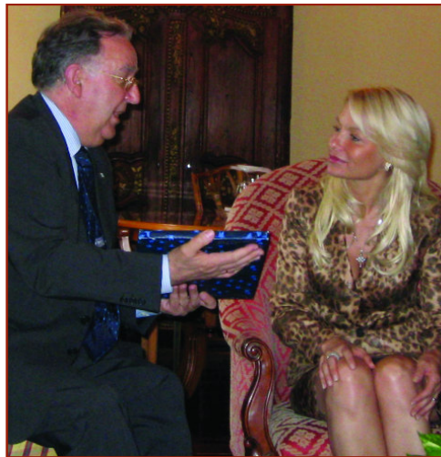
Chato con la Primera Dama de Honduras . FP