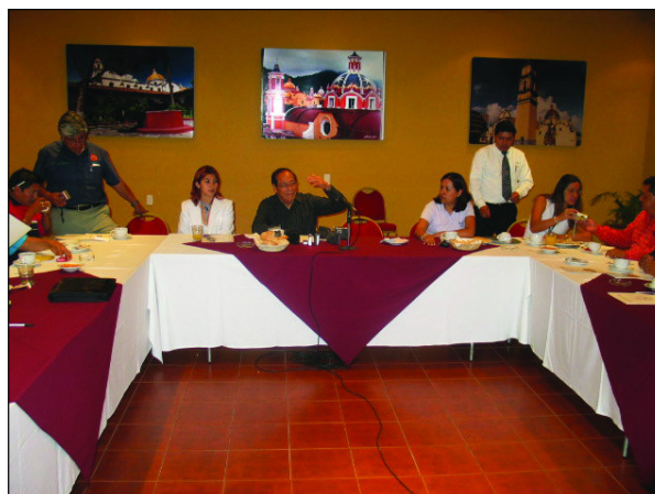
Un momento de la rueda de prensa

El II Encuentro Internacional Intergeneracional de J venes y Adultos contempla adem s de actividades culturales, mesas de trabajo y conferencias magistrales a cargo de expertos en el  rea, pertenecientes a dependencias como la Secretar a de Desarrollo Social (SEDESOL), el Sistema para el Desarrollo Integral de la Familia (D.I.F.), el Instituto Nacional para Adultos Mayores (INAPAM), la Secretar a del Trabajo y Previsi n Social (SIPS),