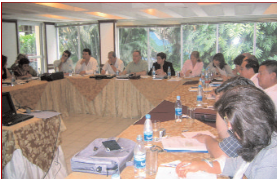
Un momento de la reunión del Consejo que tuvo lugar en Guayaquil. FP