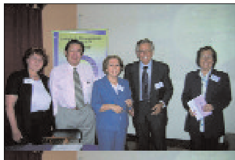
Imágenes del foro desarrollado por el Colegio de Gerontólogos de Chile A.G.FP