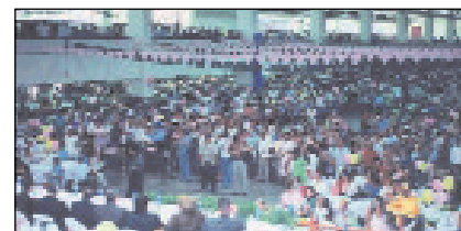
Imágenes del encuentro celebrado en El Salvador organizado por Fusate. FP