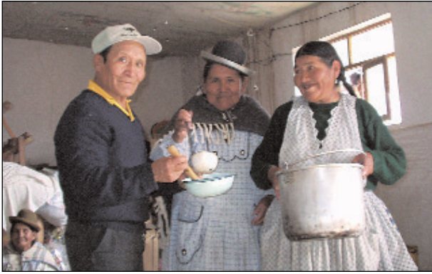
Imagen de la comunidad de Awicha. FP